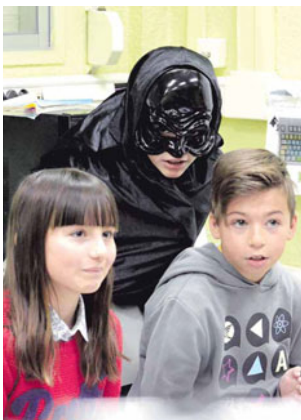
En sus zapatos es un programa apoyado en la Educación emocional y el teatro que previene situaciones de acoso.

que puedan supervisar la actividad digital de niños y adolescentes. De esta forma cuenta con planes de protección familiar; Segurescola, que es la propuesta que se realiza a los colegios; y acciones de concienciación social.