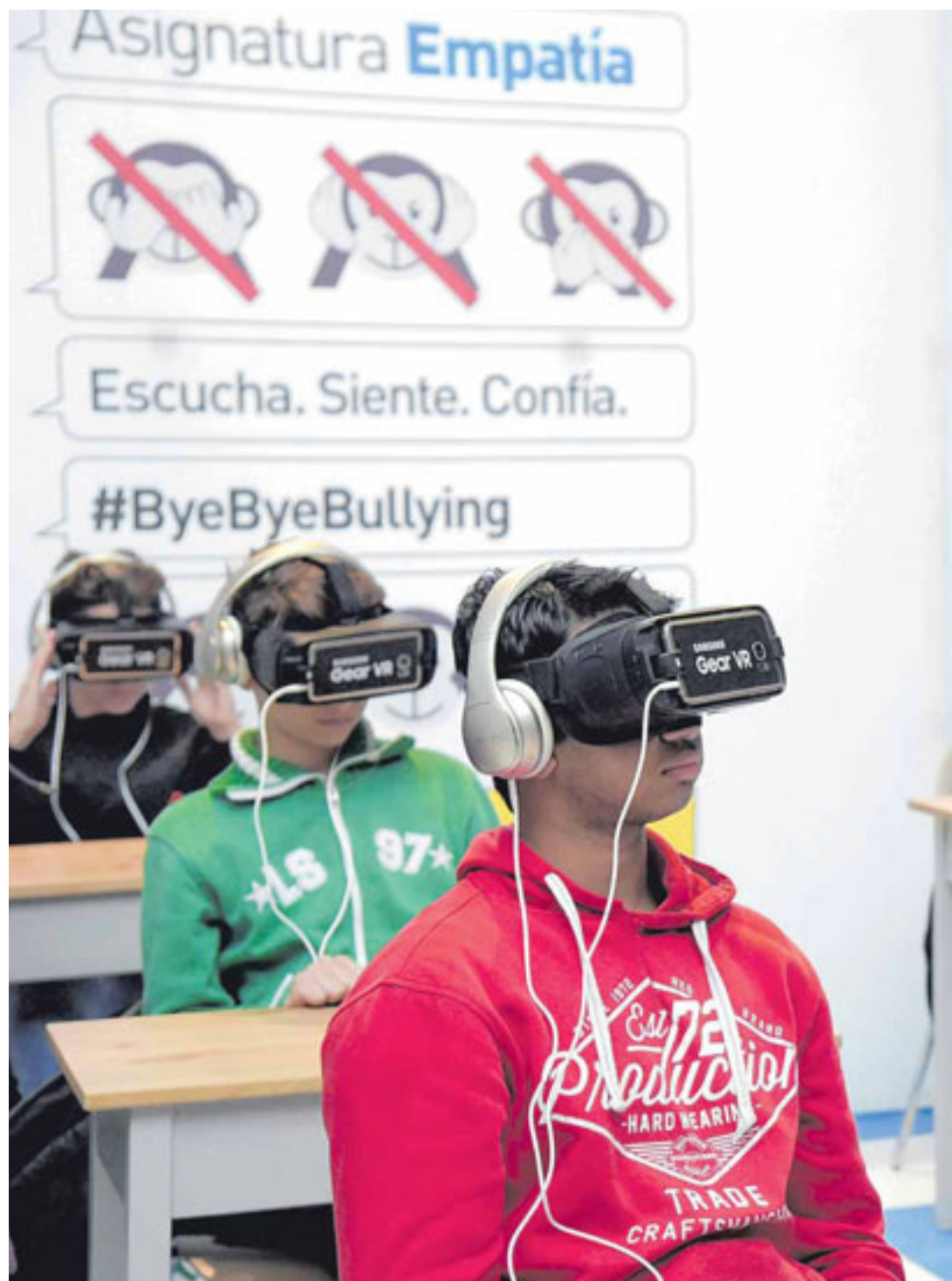
El proyecto Asignatura Empatía de Samsung recrea un caso de ciberbullying sufrido por un niño de forma inmersiva.

Además de ayudar a los alumnos a incrementar su capacidad para reconocer qué es el acoso, Asignatura Empatía también les motiva a no permanecer indiferentes ante casos de bullying de los que sean testigos, combatiéndolos con los recursos que tienen por sí mismos para resolverlos. El vídeo motiva a los niños a informar sobre los actos de bullying que presencien, especialmente a sus profesores.