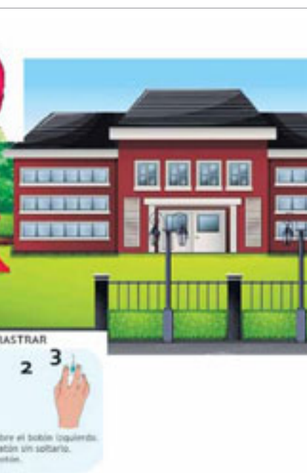
detectar a tiempo posibles casos de acoso.

que puedan supervisar la actividad digital de niños y adolescentes. De esta forma cuenta con planes de protección familiar; Segurescola, que es la propuesta que se realiza a los colegios; y acciones de concienciación social.