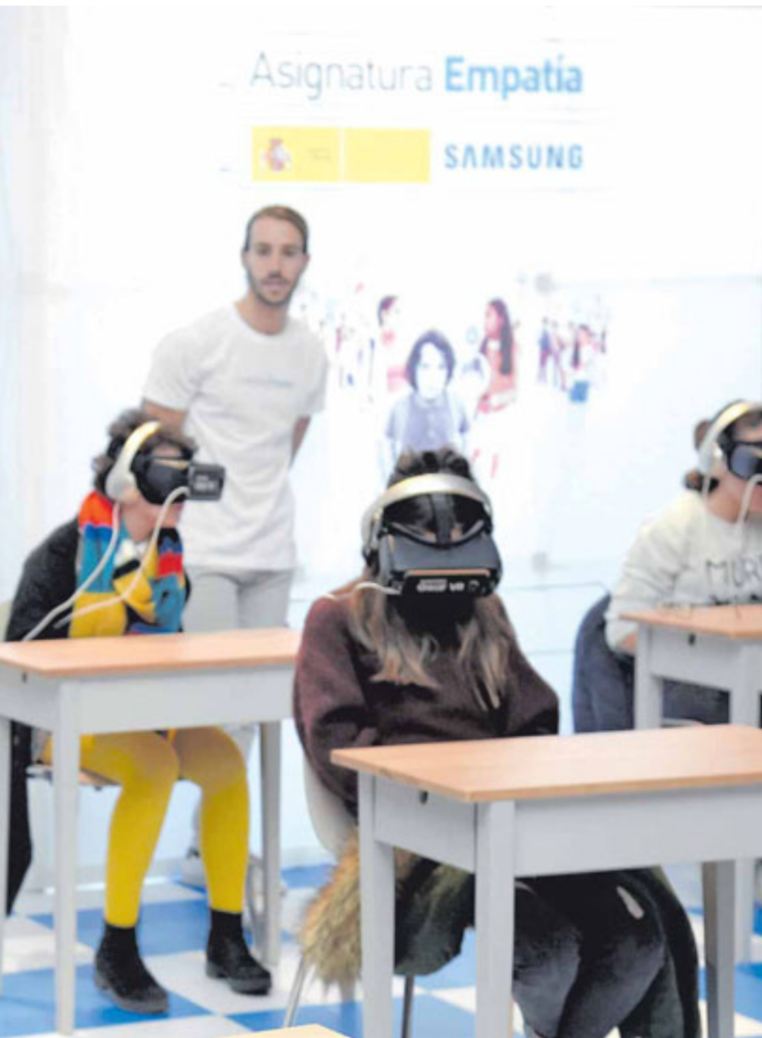
que trata de concienciar a los alumnos a través de una experiencia virtual. SAMSUNG