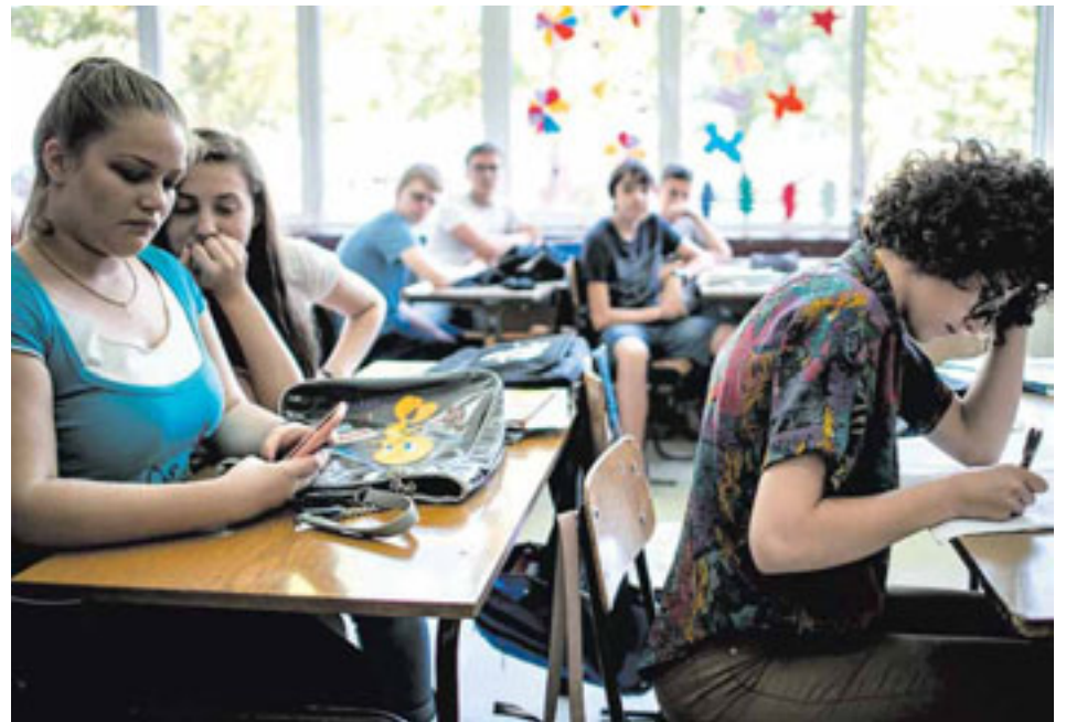
La mitad de niños de entre 13 y 15 en el mundo se ha sentido acosado.