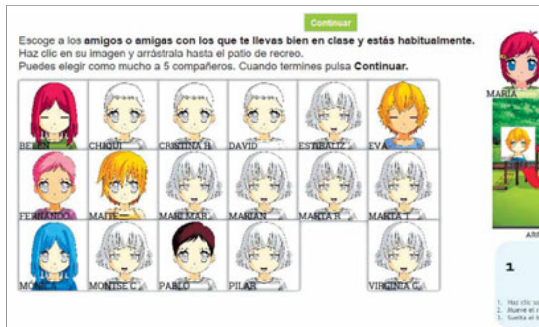
BuddyTool es una herramienta digital en forma de juego para descubrir el sociograma de la clase y detectar casos de bullying.

Otra herramienta novedosa que intenta solucionar el problema antes de que se produzca es Gaptain, una plataforma online que realiza un enfoque global, de forma que no solo abarca el entorno del alumno y el centro, sino que